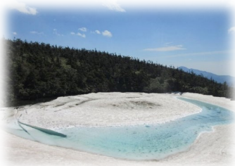
ドラゴンアイ(八幡平)