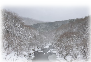
暮らす森内の景色(芸北)