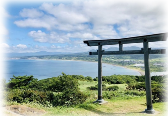
夷王山の鳥居(鹿部)