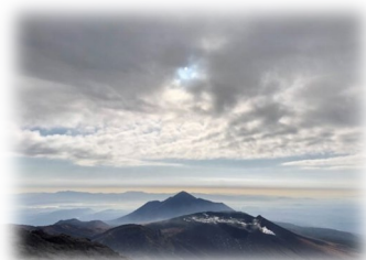
高千穂の峰(高千穂)