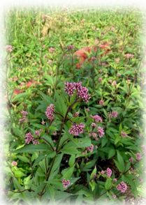
杵築のフジバカマ(杵築)